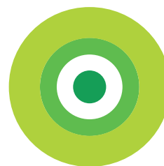
Polizze di assistenza in viaggio