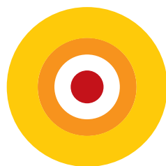
Polizze con annullamento

Un'ampia gamma di coperture assicurative, dalle polizze standard a soluzioni più specifiche, inclusi pacchetti all-inclusive. Le nostre polizze sono costantemente aggiornate per affrontare ogni viaggio con serenità, tenendo conto delle attuali aree e situazioni di rischio.